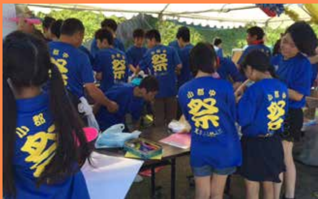
小郡地域の伝統行事「十七夜」を起源にした「ふしの夏祭り」小郡中学校の生徒有志も運営に参加。地域行事への参加で社会活動を実体験。