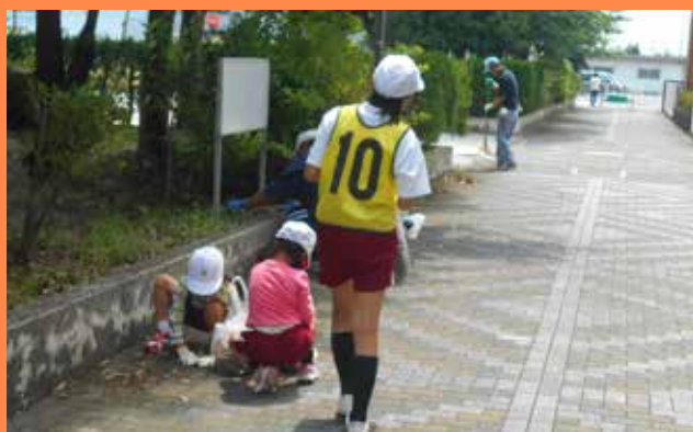
小郡南小学校では地域の人たちと協力して環境美化作業。風の並木通りをきれいにしました。

音楽も小郡地域の自慢。市内の演奏グループが一同に集まるバンドフェスティバルでは小郡地域の各学校が「小郡サウンド」を響かせました