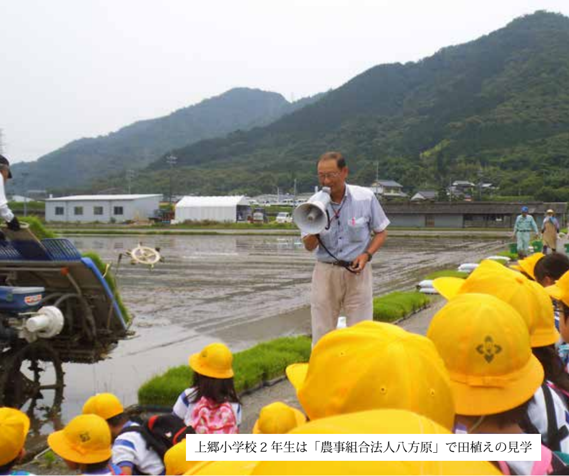
上郷小学校2年生は「農事組合法人八方原」で田植えの見学