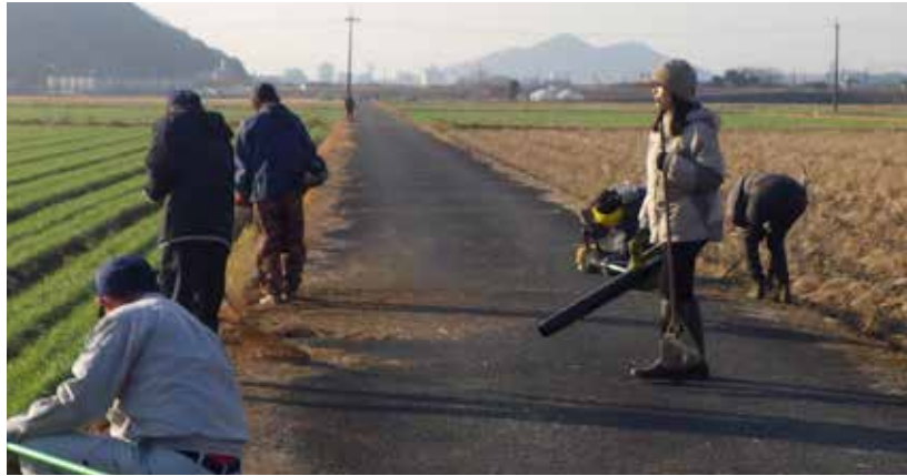
草刈り機に簞それにブロワー。いろいろな機材を使いながら作業