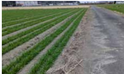
麦の成長を妨げないように雑草処理

1月18日、大森農道と中央南北道の除草清掃作業を行いました。今年と比較的穏やかな天候と、非農家の方の参加もあり18名での取組でしたので作業ははかどりしました。