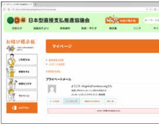
「お結び掲示板」のトップ画面、いろいろな条件をセットできる