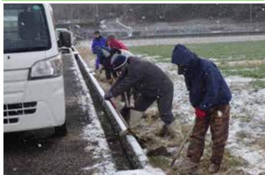
雪の中での作業はちょっと辛い

今年度の長寿命化事業は大森農道の南側水路の部分嵩上げをすることになりました。2月8日、自主施工として水路壁面の掘り出しと清掃作業を行いました。16日から本体工事が始まります。