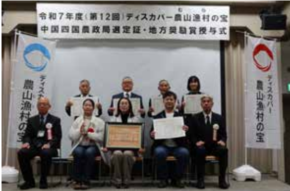
受賞団体と中国農政局の担当で記念撮影