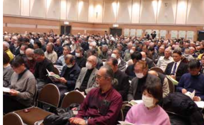
熱気に包まれた満員の会場 (2月12日 松山市正岡子規博物館)

説明会の配布資料をたどっていくとこのパンフレットが。都市水害に有効という油圧式水中ポンプ所から当該地区の排水ポンプ設置について説明がありました。 2月13日、山口市南部土木事務所から当該地区の排水ポンプ設置について説明がありました。 一部で伝えられていた150トン毎分の排水量毎分は15トンのポンプが3台となることも分かりました。機種名の150が読み違えを招いていたようです。 しかし昨年8月の緊急ポンプ設置の際の能力の3倍ですから、余裕があると考えられます。 今までの経緯から、信頼性や安全性に質問が相次ぎました。