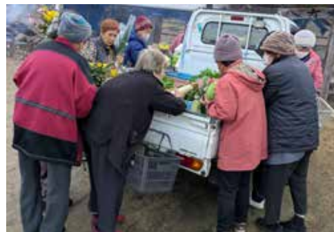
人気の品物は陳列する間もなく籠の中へ

ふれあい朝市は毎週土曜日の朝の定番行事。トラックが届いた瞬間に「勝負」が決まります。