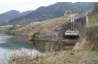
榎野川本流側はきれいに除草

ピッチで進められています。堤防から川床に降りる作業道が作られています。この作業道を使って、建設機械が作業を進め、資材が搬入されています。