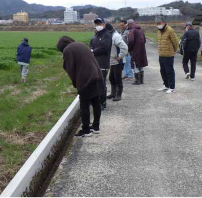
工事が計画通りにできたか、仕上がりがどうであるかを確認する完成検査（3月8日）

大森農道の南側水路は既に2度の改良工事をしています。東からベンチフリュームへの置き換え工事、その後に既存の水路の嵩上げ工事です、今回はその延長となります。