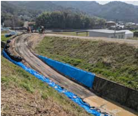
大量の土砂を使って作業用の仮設道路