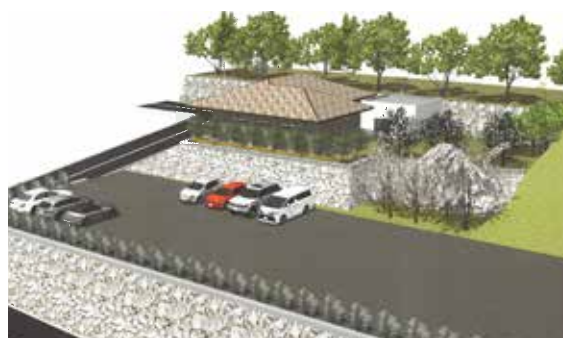
市の建築許可を得た図面からの完成予想図

ペット葬祭事業も手がける(株)プランハウスさんから、計画中の葬祭施設の概要資料が自治会に届きました。4月の総会の席で直接説明の意向があります。