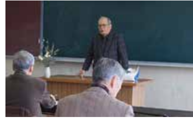
地域の文化を伝えるには

「地域の文化を伝えるためにはしっかりと勉強しなくてははいけません。」素晴らしいながらたくさんの資料や、仲間で作った参考文献などを拝見しました。調べてみると、身の回りにもいろいろな宝物があるかもしれませぬ。