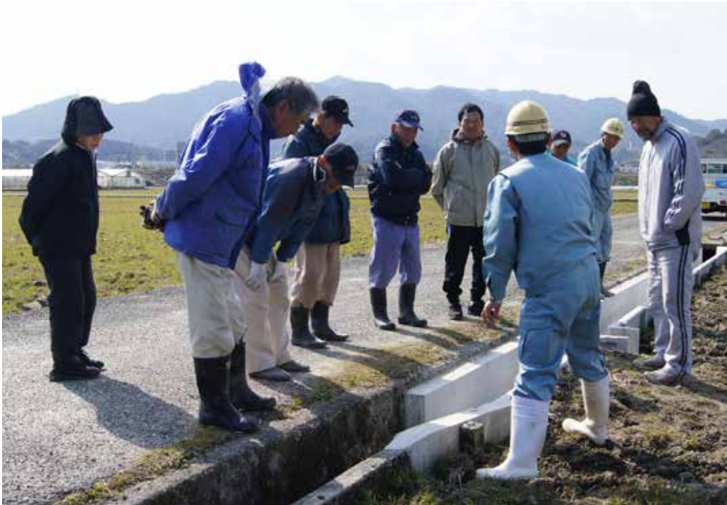
改修工事について説明を受ける関係者（2月25日）