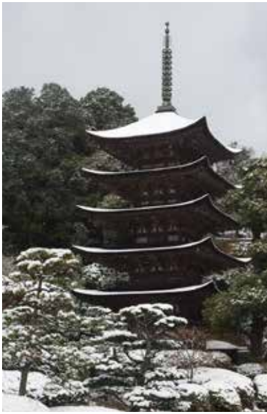
雪の季節は特に際立つ美しさ

2月8日の朝、夜明けから降り出した雪が、だんだん激しくなりました。辺りはすぐに真っ白。山口の瑠璃光寺五重塔も雪化粧です。