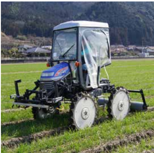
冬用のカバーで覆われた管理機

ありました。株を増やして強くするとは知りませんでした。 まだまだ寒い中、収穫を目指して作業が続きます。